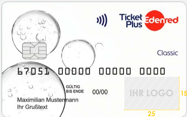
Abbildung Beispielmotiv | M: 1:1 | Maße in mm